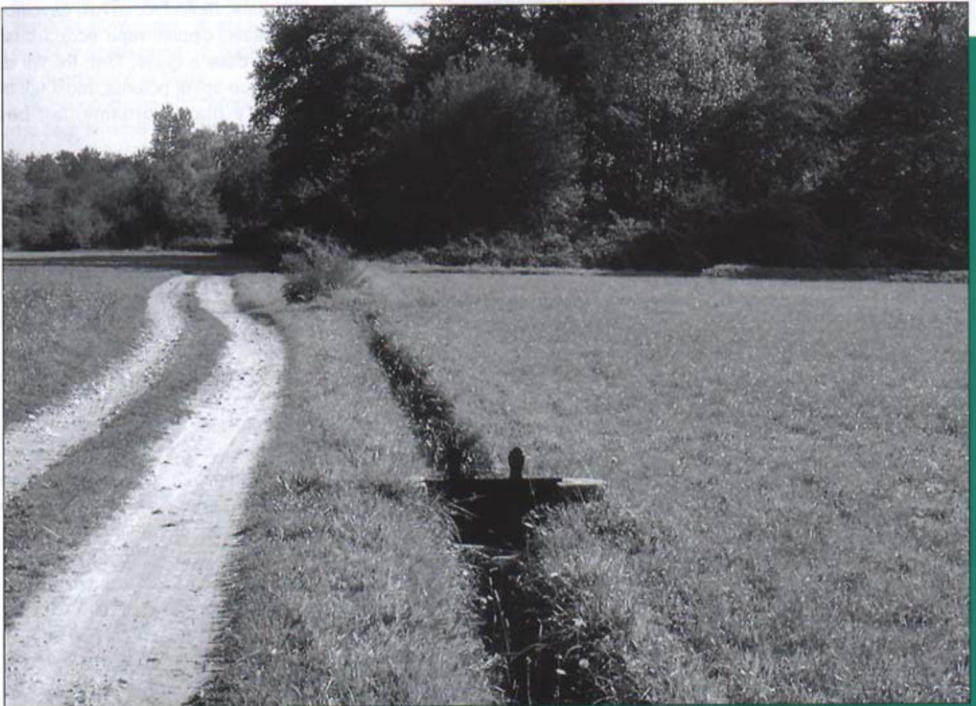
Paesaggio agricolo nel Parco del Ticino

Tutte le aziende che aderiscono al Progetto agricoltura adottano tecniche di agricoltura biologica o integrata.