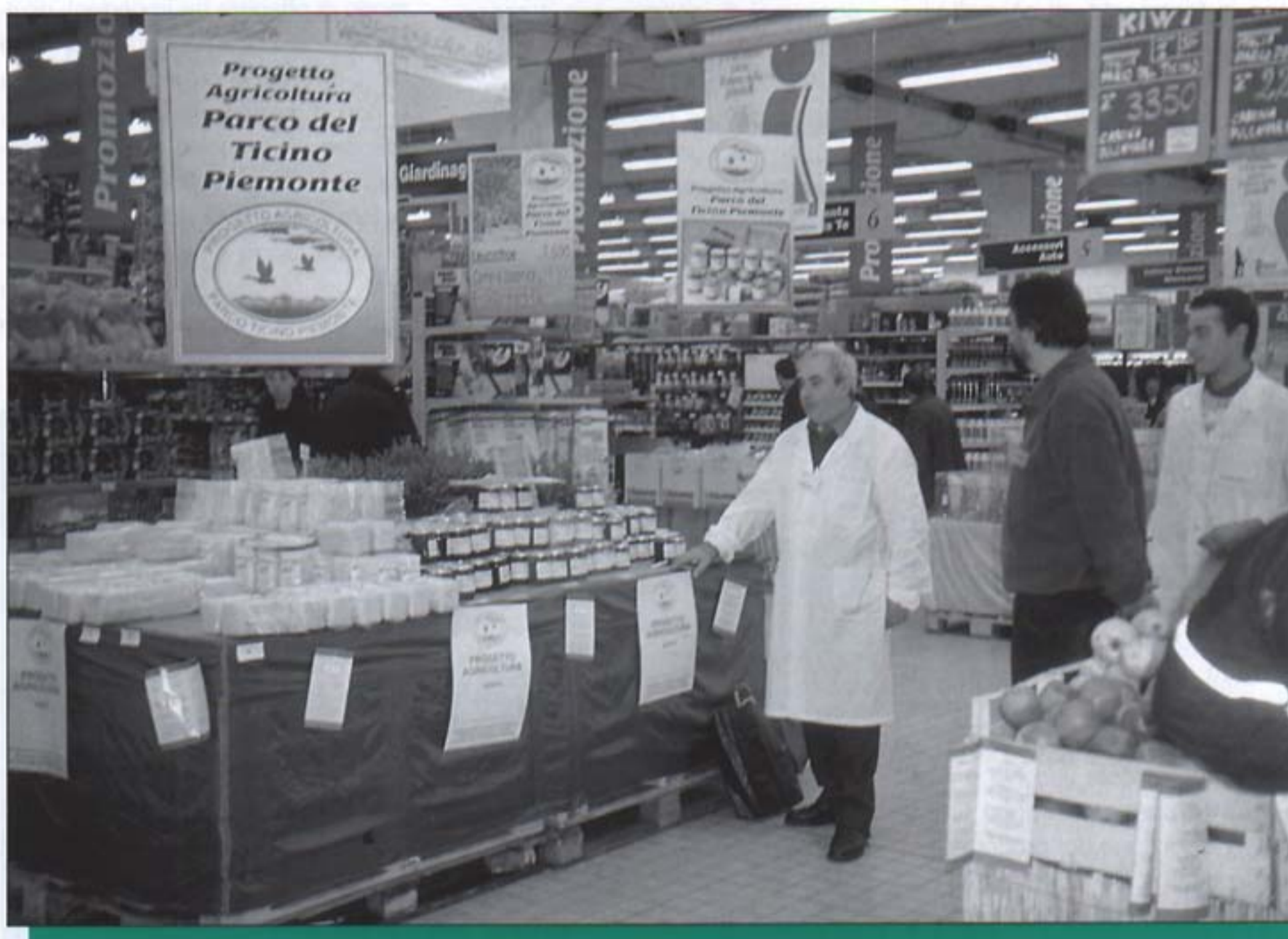
Vendita dei prodotti biologici all'IPER di Magenta