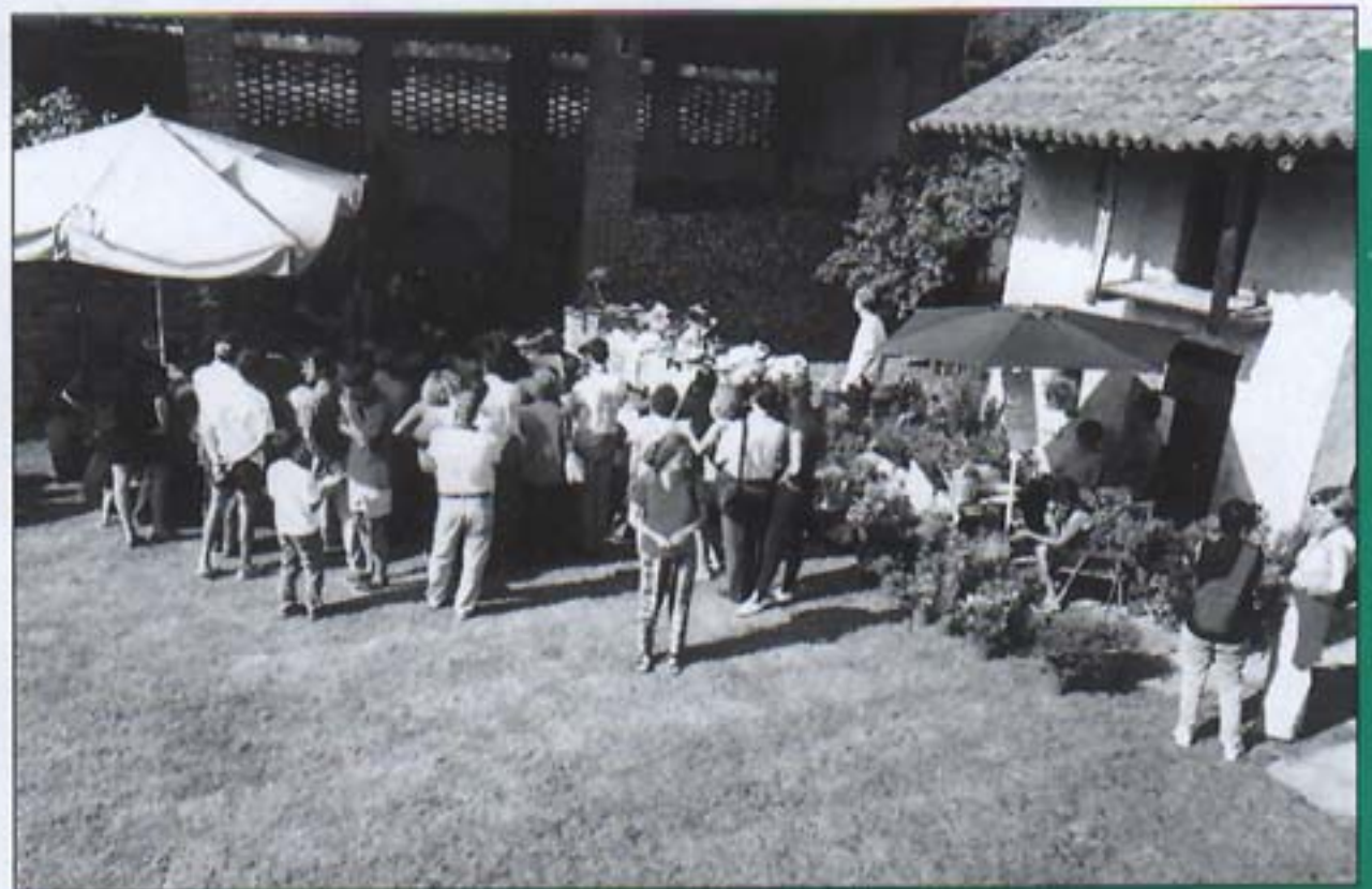
Presentazione del Progetto al Mulino Vecchio di Bellinzago

Le tre iniziative promosse nell'estate-autunno sono state il vero banco di prova del progetto e, al di là della buona riuscita, hanno dato modo di ottenere tre importanti risultati: il primo, far cooperare aziende tanto diverse, in un'ottica di alleanza e non di concorrenza; il secondo, stabilire un rapporto diretto tra produttore e consumatore, dove il coltivatore si allontana dal campo per incontrare faccia a faccia il consumatore, per conoscere e far conoscere aspettative e problemi; il terzo, e