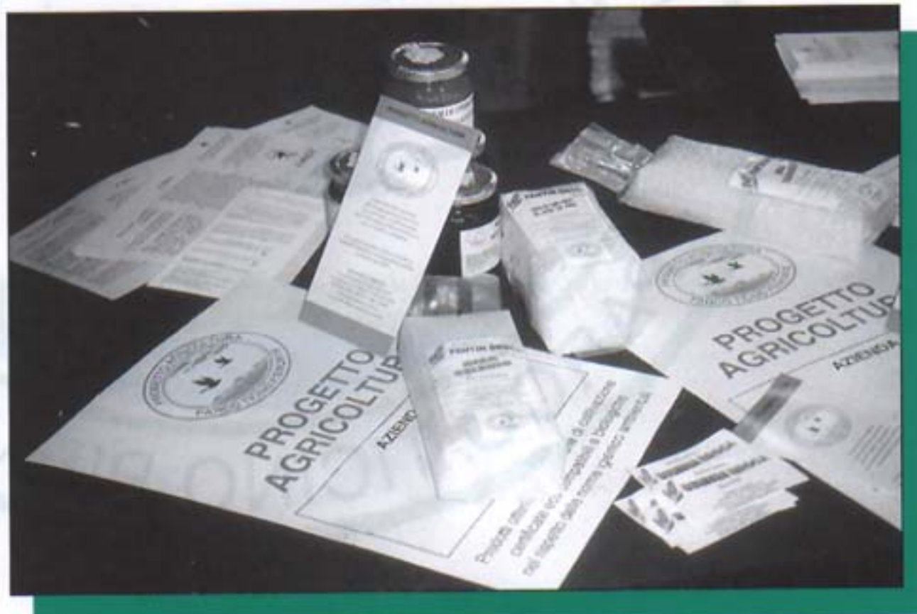
Prodotti biologici del Parco del Ticino

La prima fase del 'Progetto' è stata finalizzata a verificare il fondamento dei suoi presupposti di partenza: un'indagine su un campione di imprese agricole operanti nei Comuni del Parco si è svolta con un articolato questionario per rilevare non solo le attuali caratteristiche delle tecniche agronomiche ma anche, e soprattutto, le aspettative e le disponibilità degli imprenditori agricoli al 'Progetto'. L'inchiesta ha inoltre valutato la possibilità di elaborare, con il supporto di tecnici qualificati, programmi di produzione aziendale che considerassero la possibilità di realizzare un 'Paniere' di prodotti ecocompatibili provenienti dal Parco, mediante appositi protocolli di produzione, valorizzati da un 'Marchio di fantasia' e sostenuti da una 'Rete' di punti di vendita all'interno del Parco e da momenti programmati di valorizzazione negli